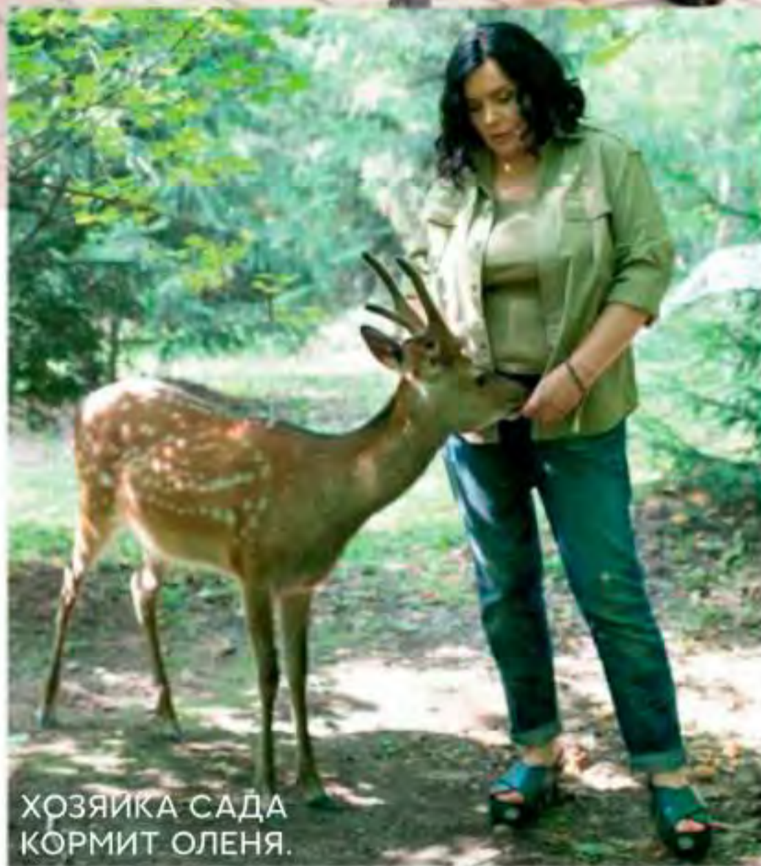
ХОЗЯЙКА САДА КОРМИТ ОЛЕНЯ.