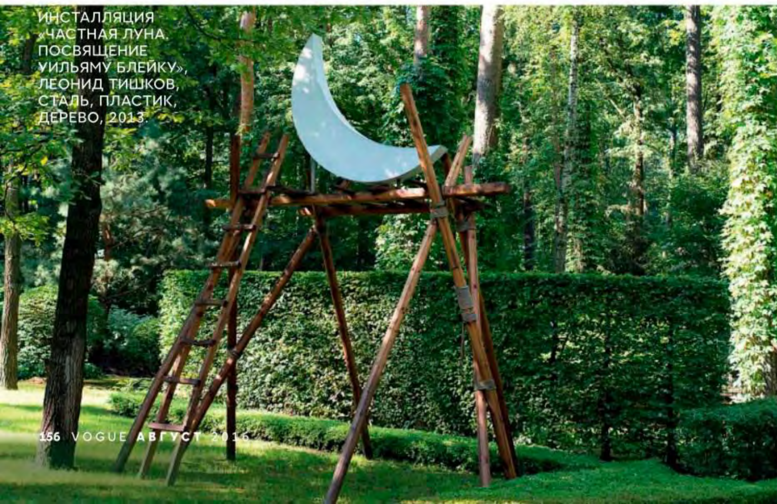
ИНСТАЛЛЯЦИЯ «ЧАСТНАЯ ЛУНА. ПОСВЯЩЕНИЕ УИЛЬЯМУ БЛЕЙКУ», ЛЕОНИД ТИШКОВ, СТАЛЬ, ПЛАСТИК, ДЕРЕВО, 2013.

насколько эти деревья совершенны. А когда на кроны ложится снег — сад становится скульптурным».